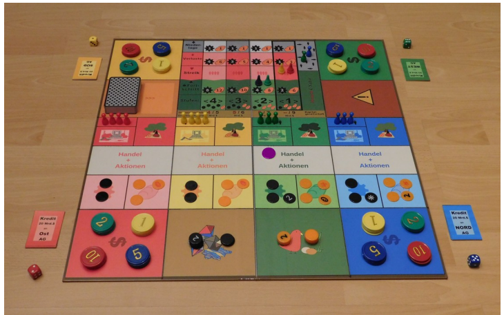
Abbildung eines Spiels aus der vom Autor selbst produzierten 1. Auflage

Plateaus und setzen ihn auf das „Fortschritt“-Feld der nächsthöheren Stufe der industriellen Produktion und Waffentechnik oder auf das „Streik“-Feld derselben Stufe. Die Stufen legen die herstellbaren Warenmengen für die Marktplätze des Unternehmens fest sowie die 1 bis 4 Aktionspunkte für seine Stärke bei Militär-Aktionen.